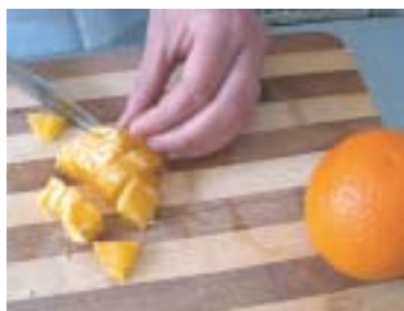
Курятину та апельсин нарізати великими кубиками, викласти по колу на тарілку