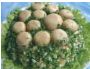
подрібною зеленою цибулькою.

Огірок накрятати кружальцями. З сирної маси зробити невеличкі кульки, кожному покласти на кружальце огірка, накрити грибною шапочкою і "посадити" на галявину. Страву прикрасити