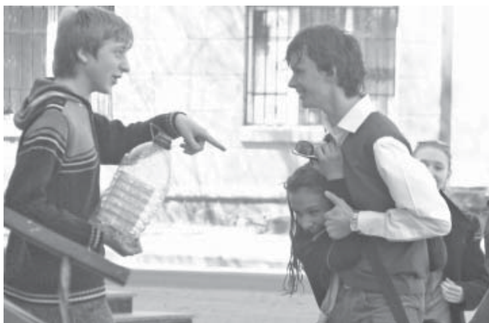
У понеділок, 25 квітня, на Театральному майдані молоді хлопці обливали всіх перехожих водою. Більшість людей жарт зрозуміли, але декого це образило

Читачі сайту te.20minut.ua активно обговорюють статтю “Тернопіль: за обливаний понеділок — до відділку” за адресою http://te.20minut.ua/news/10196823 . Вона вийшла у “20 хвилин” за номером 49.