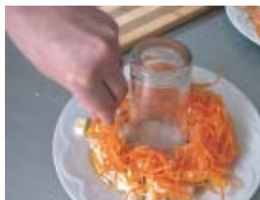
Наступний шар — корейська морква, далі — тертий сир, полити майонезом