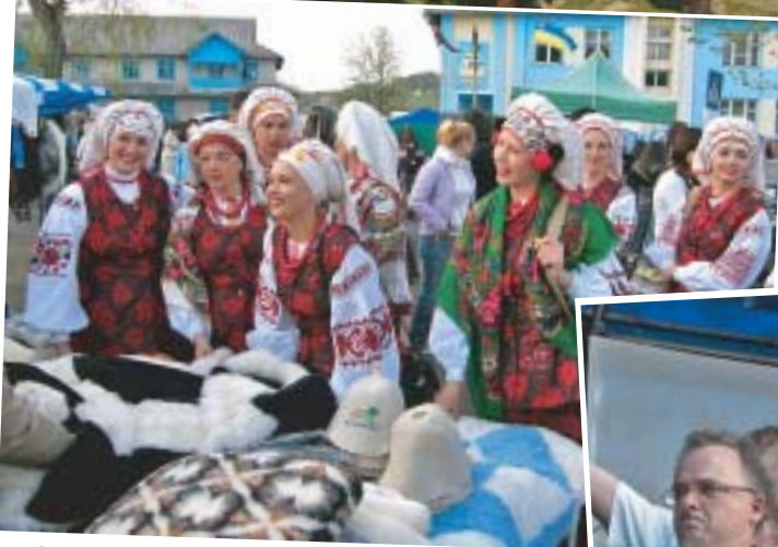
Під час "Битви націй" у Хотині пройде чемпіонат світу з історичного середньовічного бою

Фестиваль "Великдень у Космачі" пройде в етно-стилі. Виступатимуть фолкові гурти