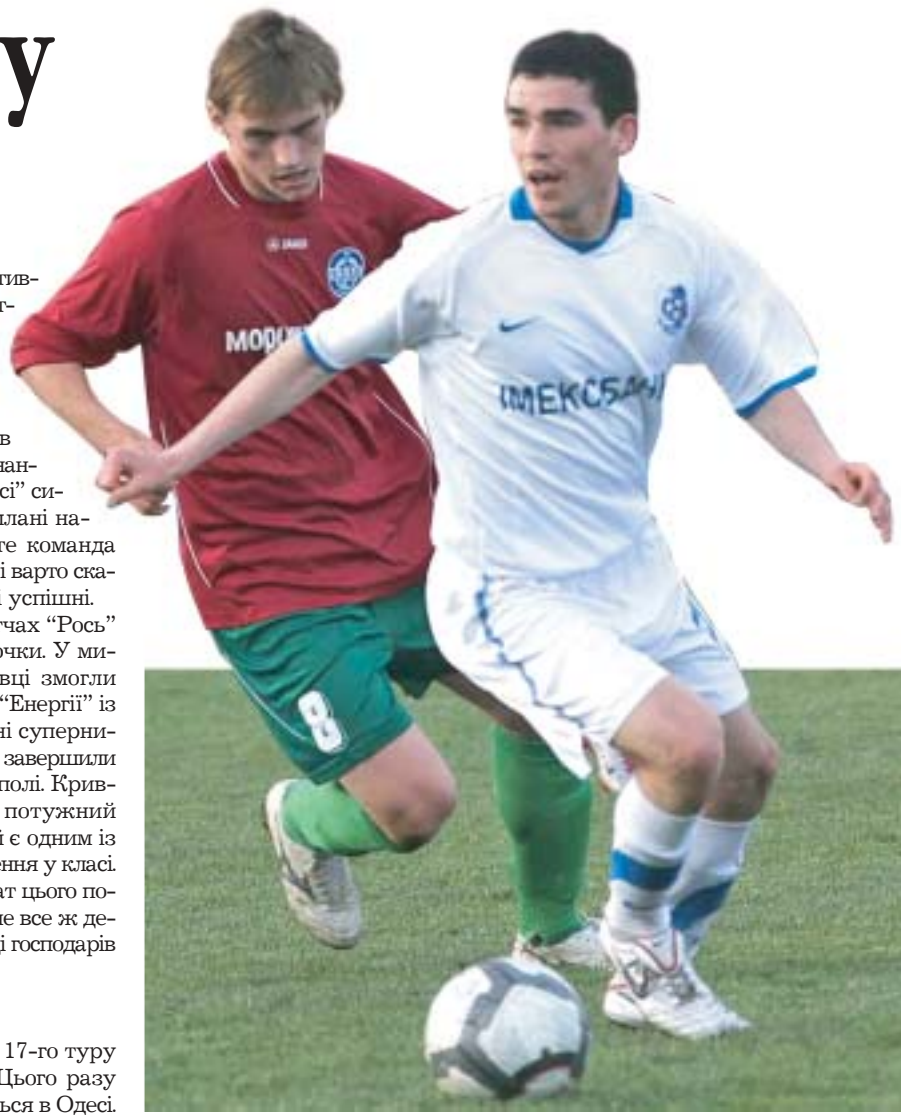
Попередній суперник "Ниви" "Чорноморець-2" (у білому) цього разу прийматиме участь у поєдинку проти "Бастіона"

Одесити свій останній матч провели у Тернополі. Поєдинок проти "Ниви" видався дуже важким. Тернопільяни постійно атакували і втратили кілька нагод, щоб перемогти.