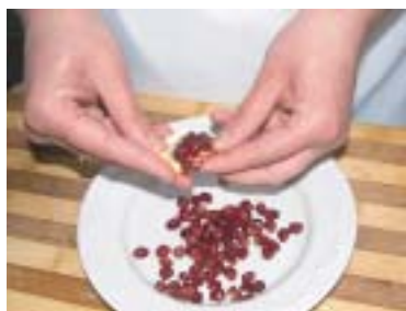
Відділити зерна граната від шкірки та плівок, притрусити салатну гірку