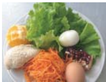
Зварити м'ясо, яйце, почистити апельсин, помити салатне листя, приготувати корейську моркву

40 г вареного філе курки, 25 г голландського сиру, 1/2 яйця, 40 г моркви по-корейськи, 30 г апельсина, 15 г зерен граната, 10 г салатного листя, майонез, спеції.