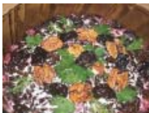
цього охолодити, почистити і натерти на тертці з великими отворами. Горіхи дрі-

Буряк добре помити і зварити в підсоленій воді, після