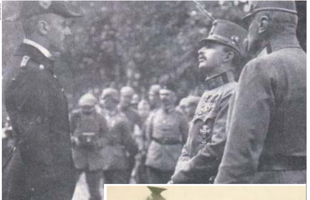
Карл I Габсбург — останній імператор Австро-Угорської імперії — відвідав Тернопіль 30 липня 1917 р. Через 2,5 місяці він дозволив українцям утворити свою державу

Останній імператор Австро-Угорської імперії Карл Габсбург приїхав у наше місто 30 липня 1917 р. Пруська армія тоді ще перебувала у Тернополі. Показово, що Карла тернополяни зустріли більш радо, аніж Вільгельма — з квітами та радісними вигуками, пише краєзнавець Любомира Бойцун. Особливо