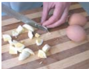
Яйце накрятати кубиками, викласти наступним шаром, полити майонезом