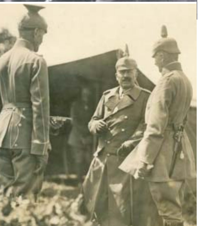
Вільгельм II Гогенцоллерн приїжджав у наше місто 25 липня 1917 р., після того, як його вояки вигнали росіян

імператор зустрівся із міською владою, а тоді поїхав на фронт. Основні події довкола тих відвідин відбулися на теперішньому майдані Волі.