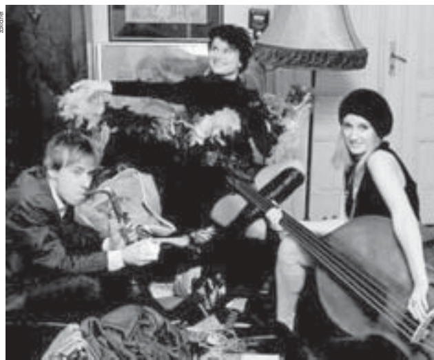
Учасники гурту “ДагаДана” на фестивалі у Польщі цьогоріч перемогли одразу у двох номінаціях

Музика “ДагаДана” цікава тим, що учасники гурту сміливо змішують джаз із фолком, drum&bass та електронікою. При цьому вони створюють як мрійливо-ніжну, так і наповнену експресією музику. Неординарності та емоційності виступам музикантів додають використання на сцені губної гармоніки, дитячих іграшок та іграшкових музичних інструментів.