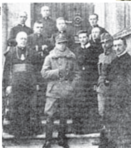
Вільгельм Габсбург гостював у 1918 р. у тернопільських священників