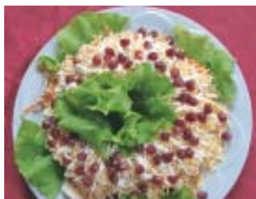
Прикрасити смаколик зеленню. Готовий салат виглядає по-весняному свіжо і яскраво